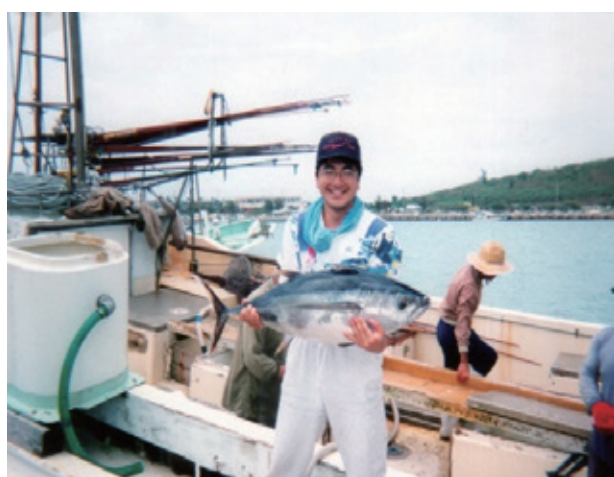
写真2：カツオ産業体験学習洋上実習 (カツオ一本釣り・漁獲)