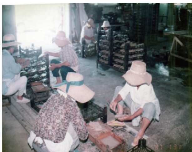
写真4：カツオ産業体験学習陸上実習 (鰹節製造・修繕)

2つである。洋上実習では、男子教諭と一部の女子教諭が出港から活餌採捕、魚群探索、パヤオ周辺海域での釣獲、漁獲物収納、帰港という一航海を体験した。陸上実習では、女子教諭のみが生切り、カゴ立て、煮熟、骨抜き、焙乾、修繕、再焙乾、日乾という一連の作業工程を経験した。(写真1～4参照)