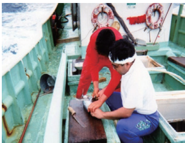
写真1：カツオ産業体験学習洋上実習 (カツオ一本釣り・解体)