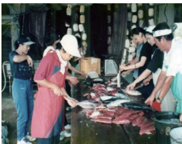
写真3：カツオ産業体験学習陸上実習 (鰹節製造・生切り)