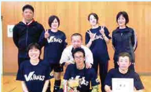
2部 優勝 buaブルス