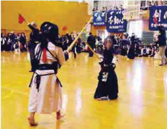
熱戦を繰り広げる少年剣士たち