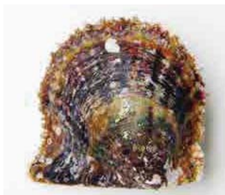
真珠母貝として用いられるアコヤガイ

真珠母貝とは真珠を生み出す貝のことを指し、日本では主にアコヤガイが用いられています。愛南町は日本一の母貝産地であり、真珠養殖の出発点となっています。