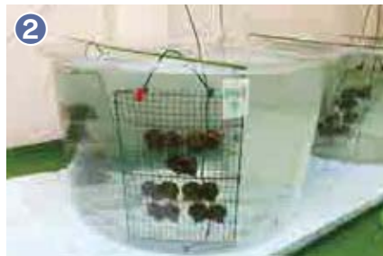
2 選抜した親貝を約1か月間飼育し、採卵の準備をしています