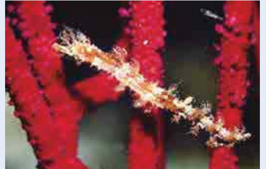
タツノイトコとヤギ (サンゴの仲間)

タツノオトシゴは、みんなが知っている魚の一つだろう。水族館で本物を見た人も多いのではないだろうか。漢字で「竜の落とし子」と書くことから、昔の人も竜を想像したのだろう。泳ぎは苦手で、ヤギや海草に体を巻き付けてユラユラしていることが多い。愛南の海にも生息しており、ダイバーにも人気の魚である。よく知られている魚だが、数は少なく、自然の中で見つけるのは簡単でない。