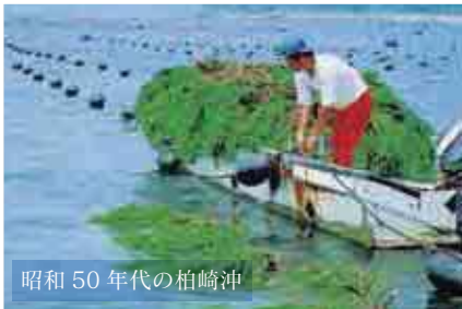
杉葉を海につけて稚貝を採取する「天然採苗」