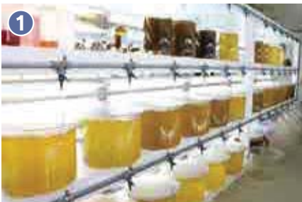
1 海洋センターの飼料室でアコヤガイの餌となる植物プランクトンを培養しています