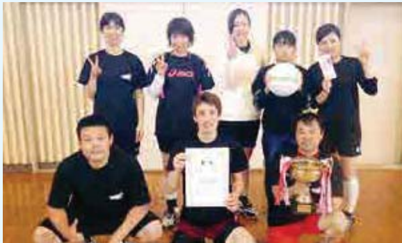
1部 優勝 irodori Z