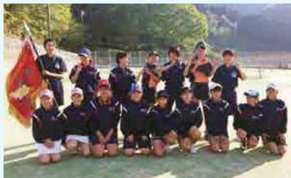
女子団体 優勝 城辺中 A

愛南町御荘 B&G 海洋センターで「第25回フレンドリーカップソフトバレーボール大会」が行われ1部、2部合わせて12チームが参加して熱戦を繰り広げました。