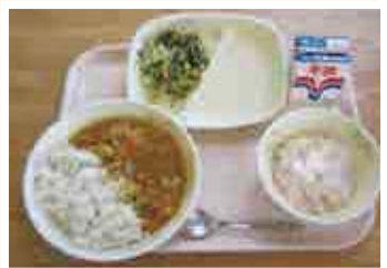
4月の学校給食 「愛南新玉ねぎカレー」です!

食育の日には、大きな声で「いただきます」「ごちそうさま」といったり、家族全員そろって楽しく食事をするなど、ご家庭でも少し「食」を意識してみてください。