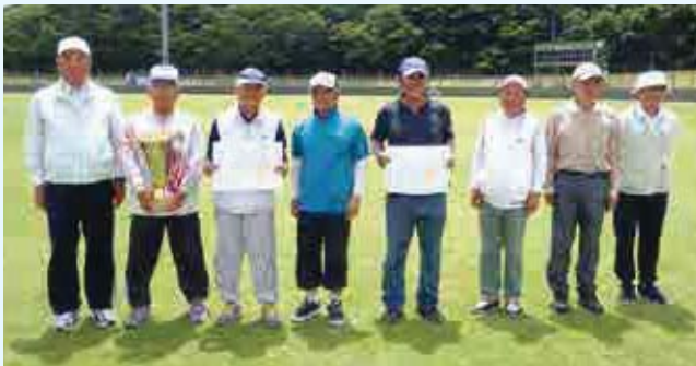
左から城辺クラブA・愛南広見B