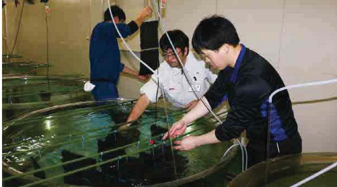
愛南町海洋資源開発センターにおけるアコヤガイの稚貝出荷の様子

県内における真珠母貝養殖のピークは、生産量ベースで平成元年、生産額ベースで昭和60年であり、昭和50年代半ばから平成6年頃（アコヤガイの大量へい死が起きた時期）までが最盛期であったと言えます。