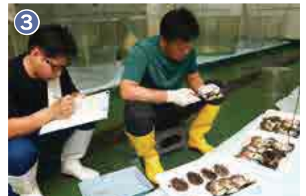
3 親貝の肉質や真珠層などから品質を評価し、採卵に用いる貝を決定します