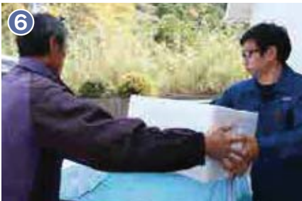
6 付着器を容器に入れ、4月から5月頃に愛南町の母貝養殖業者に稚貝を出荷します