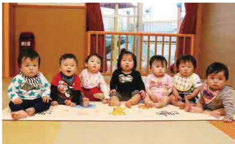
●はまゆう乳幼児保育所 れんげ組【0歳児】 お座りも上手になったよ。いっぱい遊んで大きくな～れ!