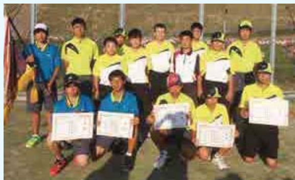
男子団体 優勝 御荘中 A