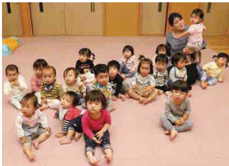
●はまゆう乳幼児保育所 すみれ組【1歳児】 毎日元気に遊んでま～す!!