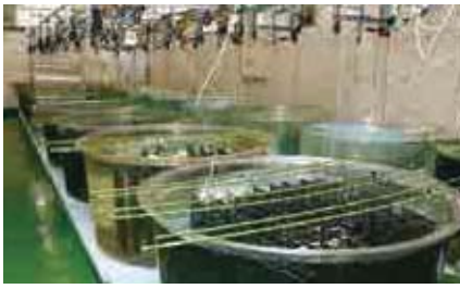
海洋センターの施設内で稚貝を人工的にふ化させる「人工採苗」