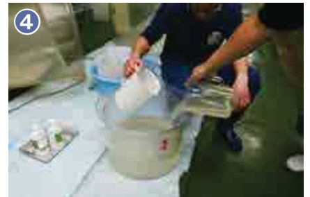
4 選抜した優良な親貝から卵と精子を取り出し、人工的に授精させます