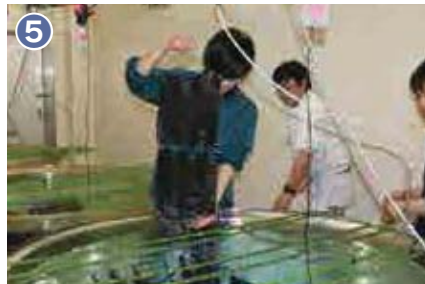
5 約40日間飼育した後、付着器と呼ばれる黒いネット1枚には2mm程の稚貝が約1万個付着しています